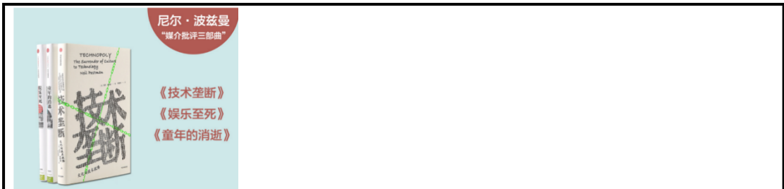
法国人文化想象中的他者建构:基于里昂的一项民族志研究